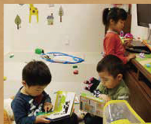
キッズスペースで お子様も楽しい！